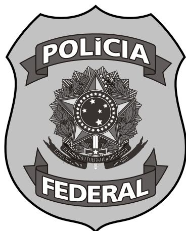
Versão 01 (uma) cor com meio-tom para uso com uma cor de impressão

Deve-se respeitar o padrão estabelecido de assinaturas sem alterar proporções, distâncias e posicionamento dos elementos construtivos do Emblema da Polícia Federal.