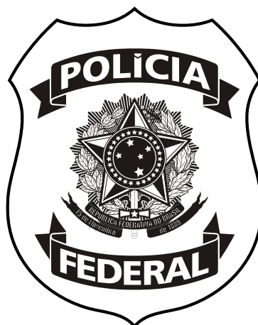
Versão 01 (uma) cor - traço

Utilizada quando a reprodução de meios-tons não são possíveis ou comprometem a qualidade.